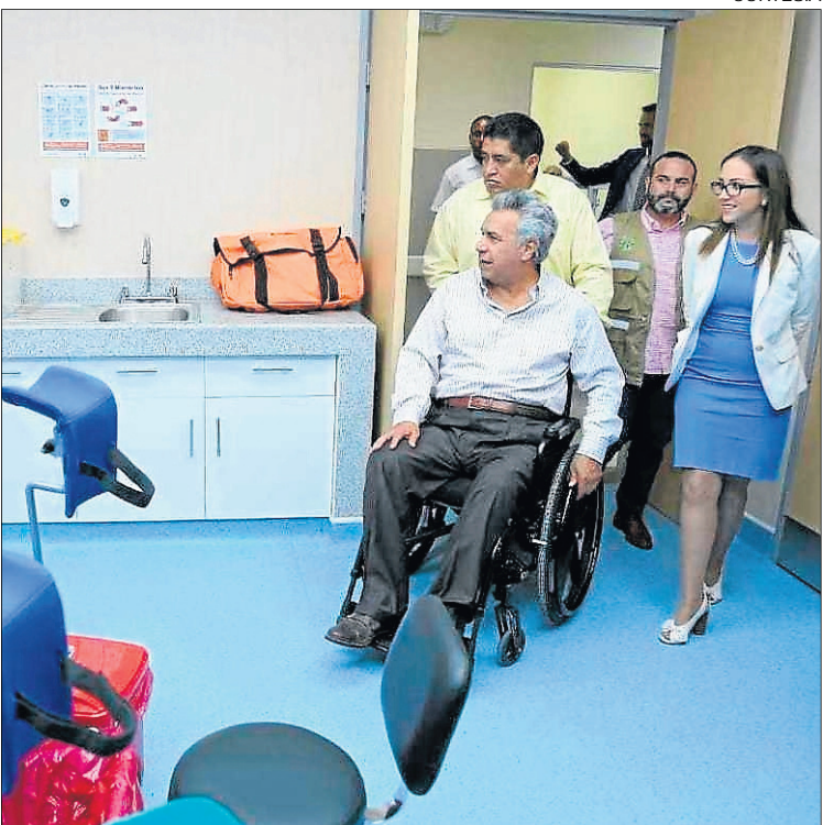
Recorrido. Lenín Moreno durante su visita al área de ginecología.

Las zonas beneficiadas de este nuevo servicio de salud, ubicado al noroeste de la ciudad son: Ciudad Victoria I y II, Ciudad Perdida, Tierra Nueva, Ciudad de Dios, Ecocity I y II, María Auxiliadora, Flor de Bastión, Poder de Dios, La Carolina, Regalo de Dios y El Triunfo.