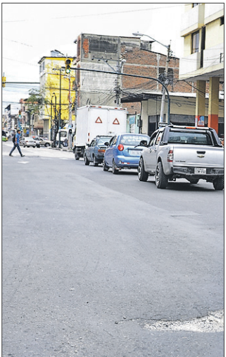
Modificación. El cambio vial se ejecutará en dos fases.