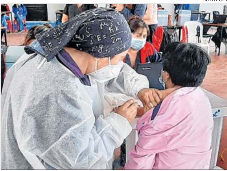
Jornada. Brigadas inmunizaron a cientos de personas en varios sectores.

Las brigadas desde el primer día que dispusieron el servicio,