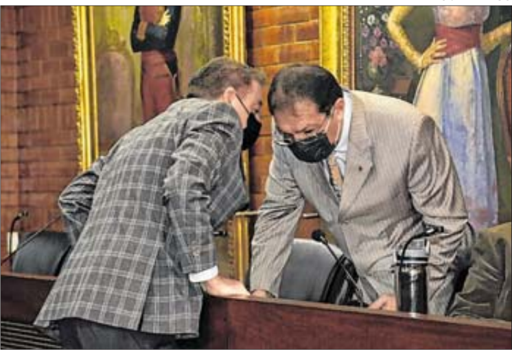
Unidad. La prioridad del Concejo Metropolitano es lograr un acuerdo.

Esta semana las brigadas de la Secretaría de Salud estarán en sitios estratégicos para prueba diagnóstica de antígenos COVID-19. Hoy estarán en La Ecuatoriana, en el sur. En el centro en La Libertad y Llano Chico. Además el Cabildo ha dispuesto el seguimiento de casos sospechosos para establecer un cerco adecuado, con la detección oportuna, su aislamiento e impedir el contacto con familiares y amigos. MCV