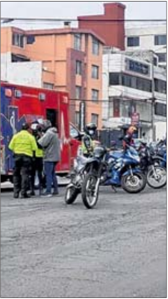
Percance. En la Av. Simón Bolívar falleció un motociclista.

El sábado, a las 08:00, en la avenida Simón Bolívar, a la altura de la Loma de Puengasí, se dio el percance más grave en el que se produjo una persona fallecida. MCV