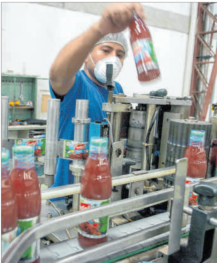
Industria. La empresa, aún sin hablar de su situación financiera.