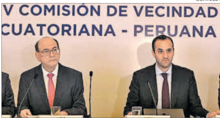
Escenario. Autoridades de Perú y Ecuador durante la firma del plan.

El canciller ecuatoriano también destacó la posibilidad de pasar revista a los avances