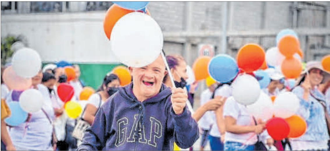
Dato. El Ministerio de Inclusión Social se unió a las actividades para conmemorar a este grupo de la población.

Una de las actividades, promovidas por la Agencia Nacional de Tránsito, fue aplicar stickers en las terminales terrestres para que se respeten tarifas y espacios especiales.