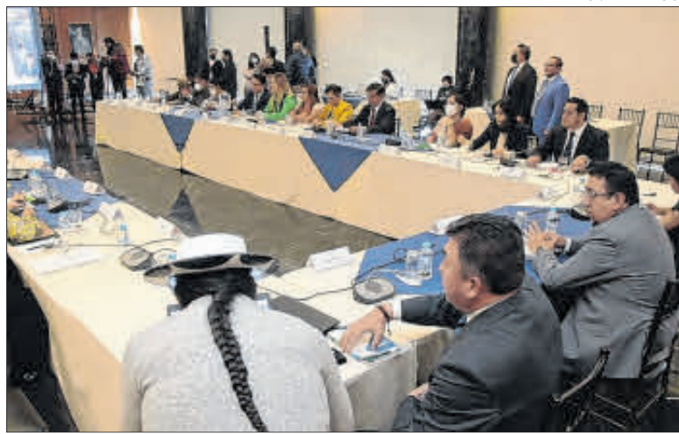
Cita. Los legisladores regresan del feriado con el afán de muerte cruzada

“Es hora de que se adopten políticas públicas de seguridad y se dispongan los recursos económicos que sean necesarios para dotación de armamento, tecnología, inteligencia y protección de la Policía Nacio-